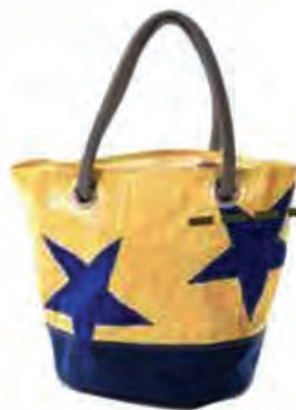
727 Sailbags, 119€

Et si on n'aime pas l'aspect rustique de la paille, on peut se rattraper avec ces modèles :