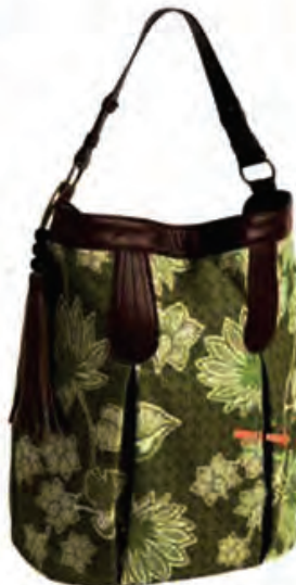
Graine de Malice, 32,95€